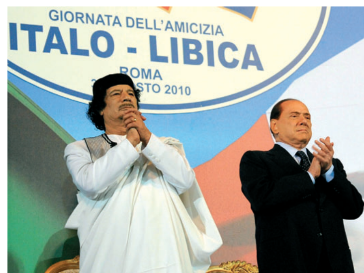
Der libysche Diktator Muammar Gaddafi und Italiens Premier Silvio Berlusconi feiern 2010 ihr italienisch-libysches Freundschaftsabkommen

2010 Im Oktober 2010 schließt die EU ein Abkommen mit Libyen, welches EU-Innenkommissarin Cecilia Malmström als »Meilenstein im Kampf gegen illegale Einwanderung« bezeichnet. Über 50 Millionen Euro werden Gaddafi für seine Dienste in Aussicht gestellt.