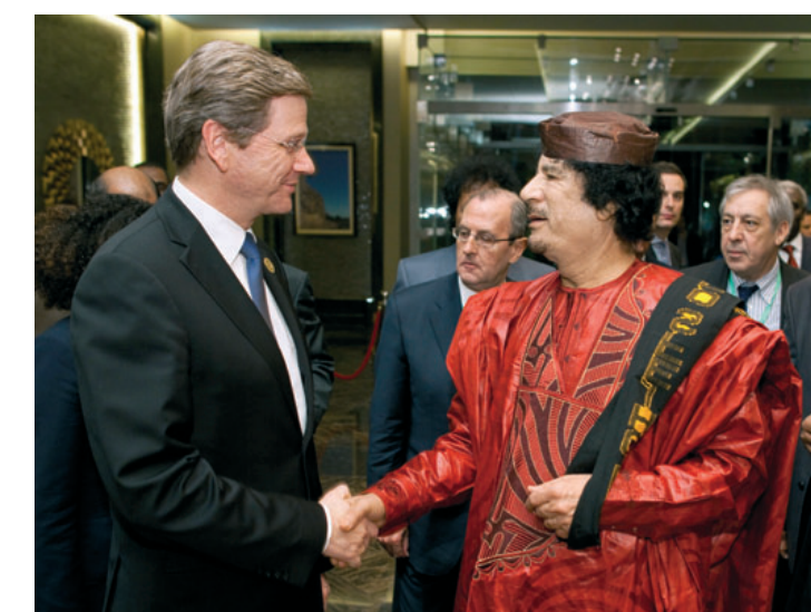
Bundesaußenminister Guido Westerwelle trifft Muammar Gaddafi beim EU-Afrika-Gipfel in Tripolis im November 2010