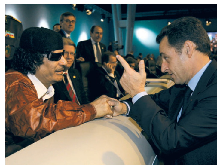
Muammar Gaddafi beim Plausch mit Frankreichs Präsident Nicolas Sarkozy während des EU-Afrika-Gipfels in Lissabon im Dezember 2007

Unterstützen Sie den Einsatz von PRO ASYL für Flüchtlinge mit Ihrer Spende: Spendenkonto-Nr. 8047300, BLZ 370 205 00, Bank für Sozialwirtschaft Köln.